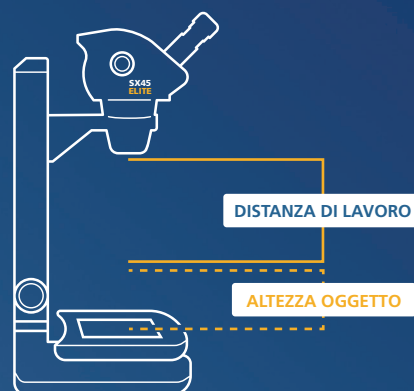
Distanza di lavoro con spazio per l'oggetto

La distanza tra l'obiettivo e l'oggetto è la distanza di lavoro.