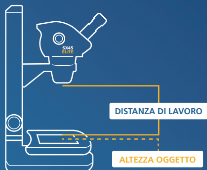
Distanza di lavoro dalla base